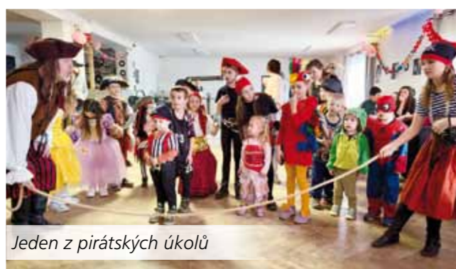
Jeden z pirátských úkolů