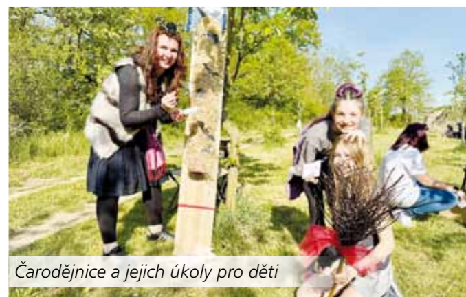
Čarodějnice a jejich úkoly pro děti

Pak už jen stačilo na konci odpovědně škrtnout zápalkou a velká