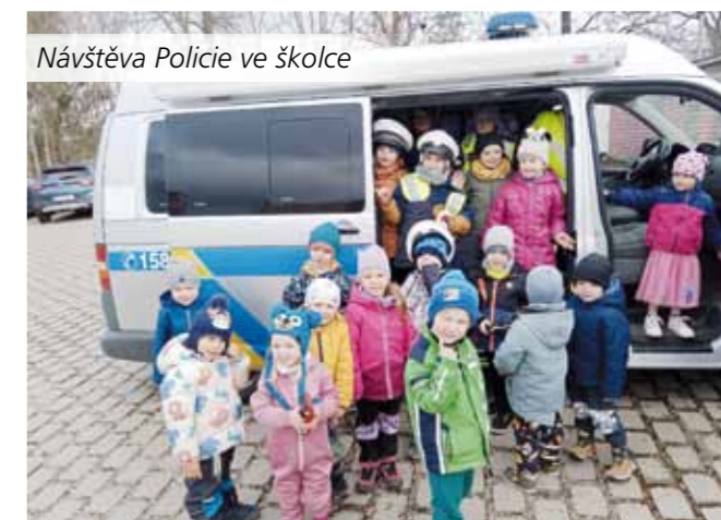
Návštěva Policie ve školce