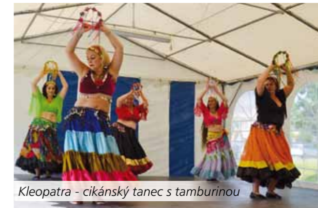
Kleopatra - cikánský tanec s tamburínou

Kleopatry, ani flamenco Suerte s jedním vějířem na známou skladbu zpěvačky Shakiry a flamenco Amaya se dvěma vějíři.