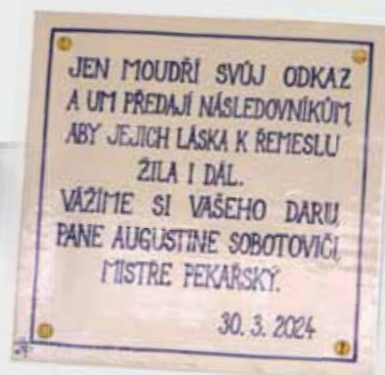
Pamětní deska v Altánu v Úsilném