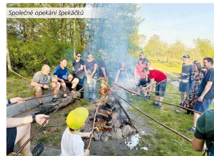
Společné opekání špekáčků