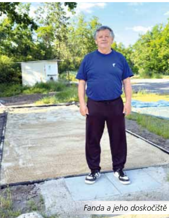
Fanda a jeho doskočiště

24.–26. 5. 2013 proběhly první sportovní hry v Úsilném. Zúčastnilo se jich 26 dětí ve věku 6–15 let. Disciplínami byly běh na 300m, slalom s míčem kolem kuželů a běh na 50m s míčem.