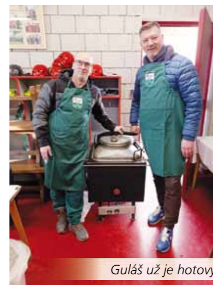
Guláš už je hotový