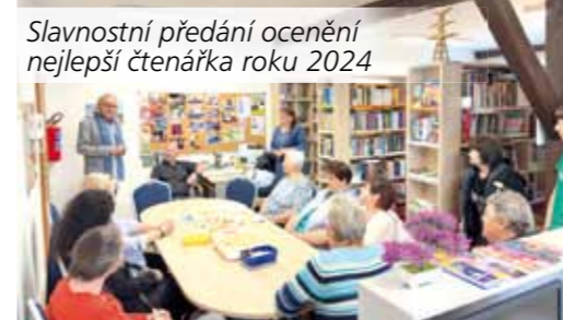
Slavnostní předání ocenění nejlepší čtenářce roku 2024