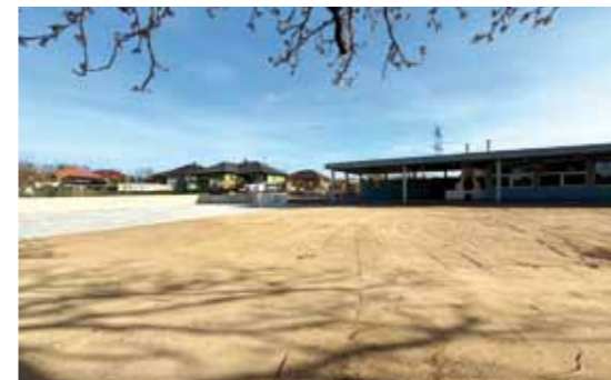
Terénní úpravy kolem základové desky budoucího sálu

Ještě se chci vrátit k jedné větší letošní investiční akci, která trochu rozvířila veřejný prostor: základová deska budoucího sálu. Původní myšlenka vznikla již před několika lety a od té doby se řešila snad na každém zastupitelstvu. Původně mělo jít o zpevněnou plochu (dlažba, beton, asfalt...) Pod Kaštany, na které by se stavěl velký stan a jeho užívání by nebylo ohroženo blátem v případě špatného počasí. Umístění jsme zvolili na stejném místě, kde byla již v roce 2015 navržena veřejně projednaná stavba Komunitního centra I. včetně skládku. Přes četné proklamace vůdců, že výstavba komunitních center bude podporována, nikdy k tomu nedošlo.