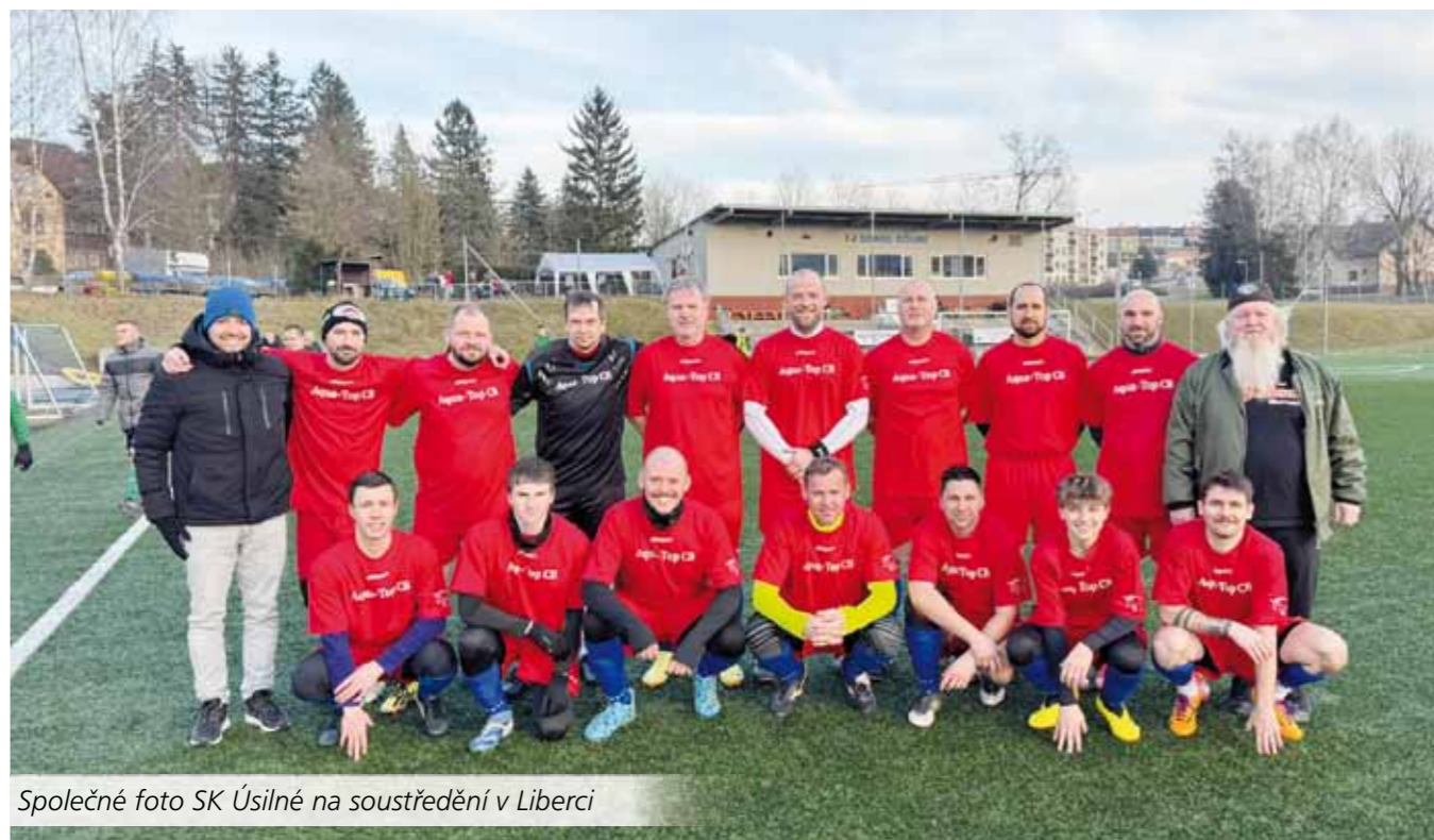
Společné foto SK Úsilné na soustředění v Liberci