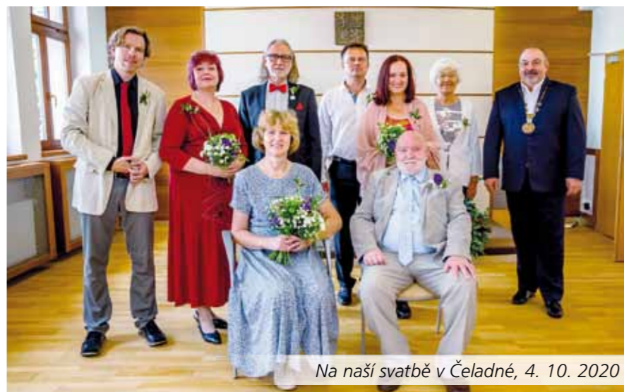
Na naší svatbě v Čeladné, 4. 10. 2020