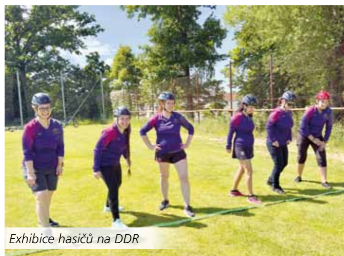
Exhibice hasičů na DDR