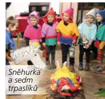
Sněhurka a sedm trpaslíků

Původně sídlila MŠ na návsi spolu s hasičskou zbrojnicí (na místě dnešního hřiště a zmrzlinového stánku). Pak se 24. 5. 1993 přestěhovala do nově zrekonstruované budovy obecního úřadu. V ní dříve sídlila obecní škola, a to již od roku 1883. V budově obecního úřadu jsme zažili ještě jednu přestavbu – modernizaci školky a přilehlé zahrady. V těchto prostorech sídlíme dodnes. Učíme se a hráme si v krásném moderním prostředí. Od roku 2013 máme navýšenou kapacitu na 26 dětí a celé ty roky máme naplněno dětmi z Voselna. Pro děti pořádáme spoustu aktivit a různých akcí, např. chodíme do přírody, kde se učíme environmentální výchovu, vštěpujeme dětem kladný vztah k přírodě, ve městě navštěvujeme divadlo, muzeum, solnou jeskyni, zapojili jsme se do celostátní akce Se Sokolem do života – cvičíme program sokolské pohybové gramotnosti, spolupracujeme také s místní knihovnou, kde jako každoročně pořádáme Noc s Andersenem s nočním přespáním ve školce. S rodiči spolupracujeme během roku na Zahradních slavnostech, kde se