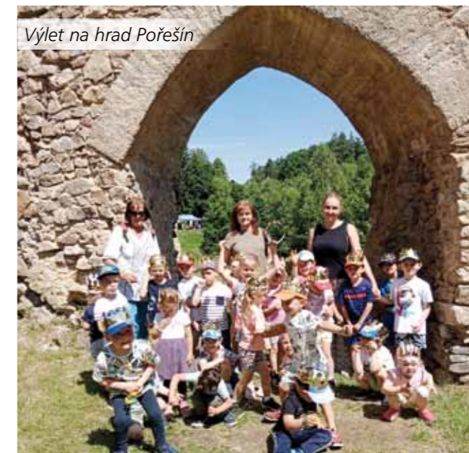
Výlet na hrad Pořešín

vždy loučíme s předškoláky, letos se čtyřmi. Dalšími akcemi s rodiči jsou Dýňování, jarmark při rozsvícení vánočního stromčeka, vánoční pečení a jiné. Zvláštní akcí je sběr papíru a hliníku (Soutěž s Panem Popelou), do kterého se zapojuje stále více lidí, a to i těch, kteří nemají své děti ve školce. Naším cílem je vštěpovat dětem základní znalosti o světě kolem sebe, vybudovat si kladný vztah k přírodě, dbát, aby si ze školky odnesly správné návyky pro budoucnost.