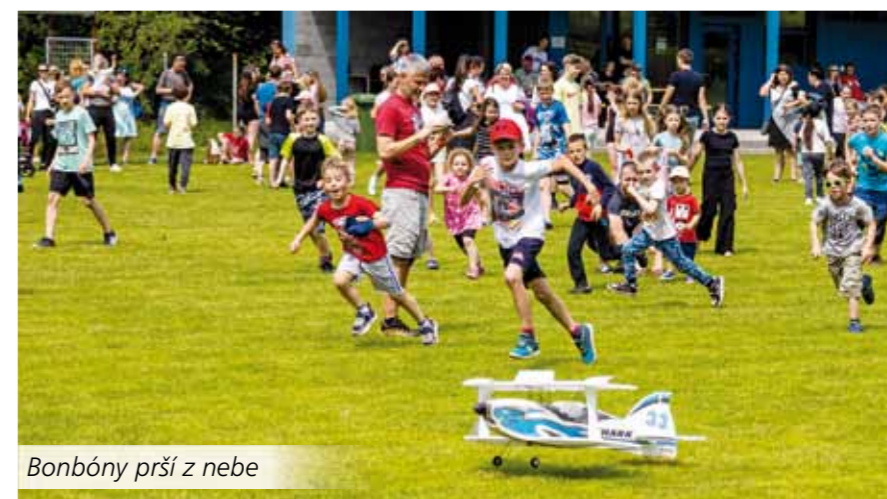
Bonbóny prší z nebe

Nedělní ráno zahájila již tradiční střelba ze vzduchovky, na kterou navázal pohádkový les. Uvítal nás dědeček, a během procházky jsme potkali např. Červenou Karkulku s vlkem, loupežníky, vílu či kouzel-