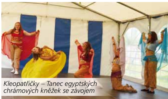
Kleopatřičky – Tanec egyptských chrámových kněžek se závojem