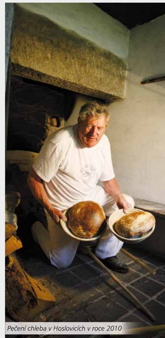
Pečení chleba v Hoslovicích v roce 2010