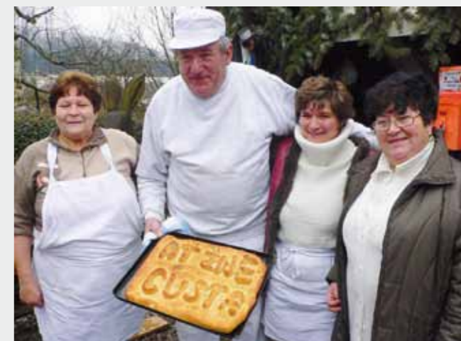
Pan mistr pekař se svou manželkou a sousedkami

Ale i smutkem. Hned vedle pece v Lenoře, kde se setkával se svojí partou měsíc co měsíc, vybuchl bytový dům. Neštěstí stálo život, zdraví nebo střechu nad hlavou mnoho lidí. Pec téměř bez úhony, vydržela i přípravná v sousední bytovce. Ale to, co bylo mezi nimi, zmizelo. Domov pro několik rodin přestal existovat. Při nejbližším pečení uspořádal sbírku. A ještě před tím věnoval čtyři tisíce korun, které měl ušetřené na nákup mouky na další lenorské