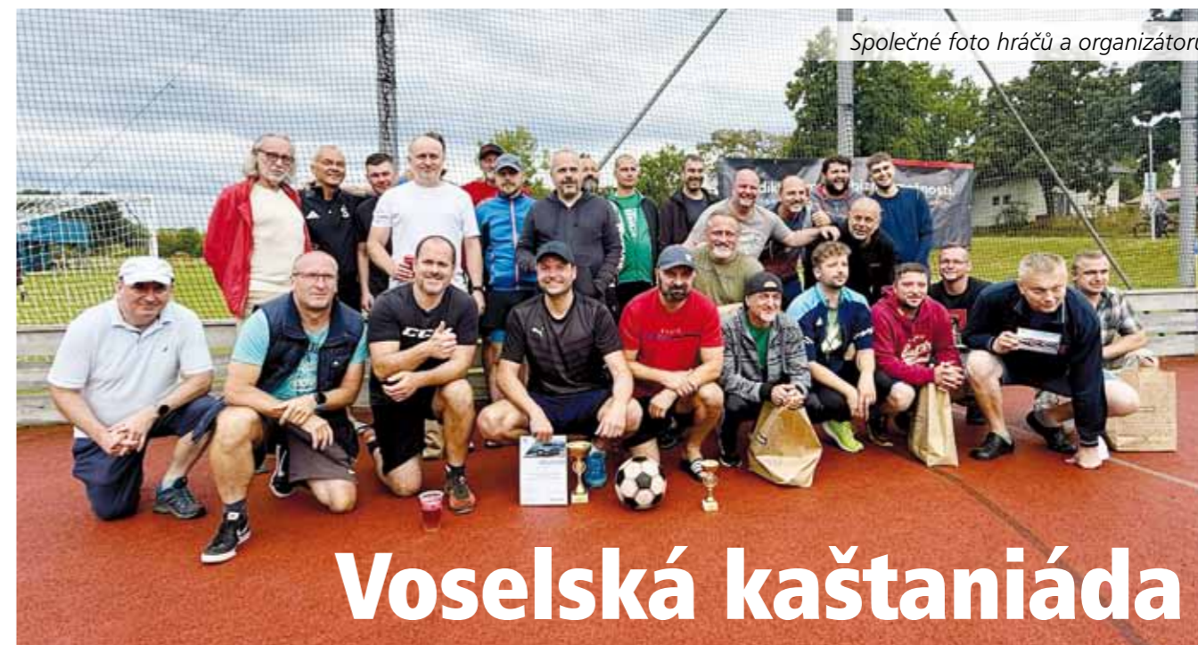
Společné foto hráčů a organizátorů