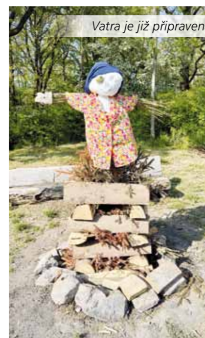
Vatra je již připravena