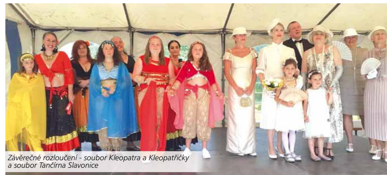
Závěrečné rozloučení - soubor Kleopatra a Kleopatřičky a soubor Tančírna Slavonice