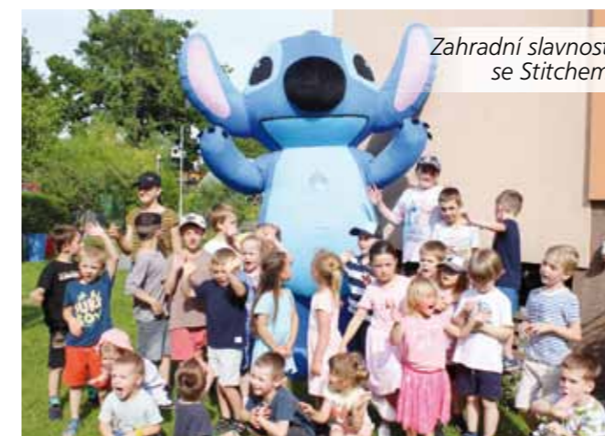
Zahradní slavnost se Stitchem