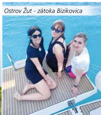
Ostrov Žut - zátoka Bizikovica