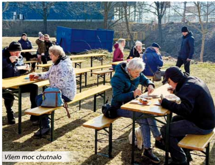
Všem moc chutnalo