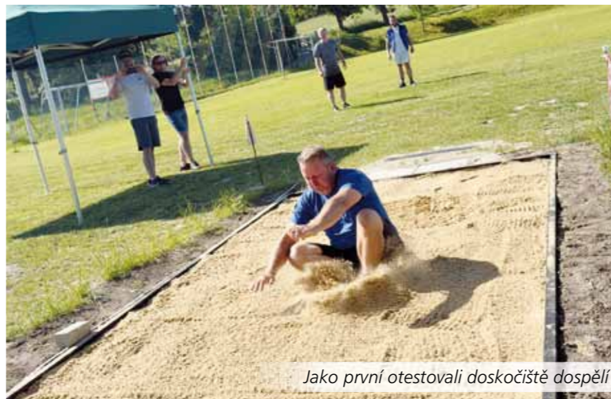
Jako první otestovali doskočiště dospělí