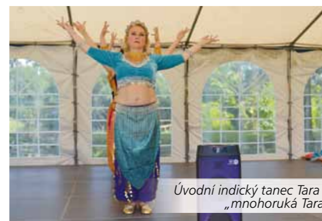
Úvodní indický tanec Tara – „mnohoruká Tara“