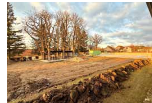
Základovou desku již využíváme na různé akce