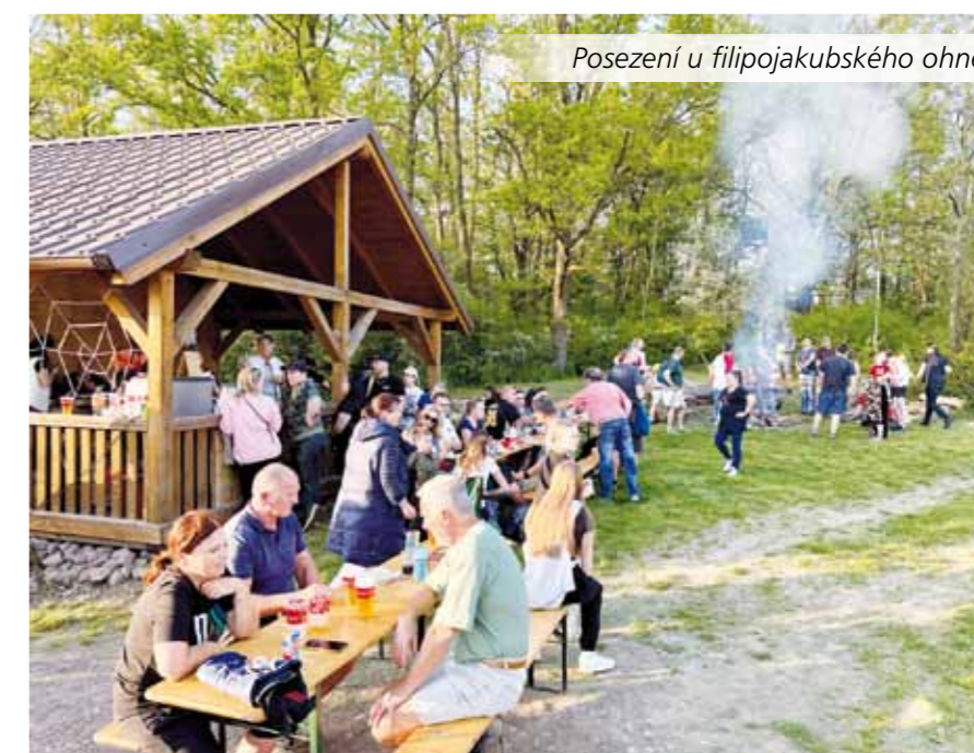
Posezení u filipojakubského ohně

vatra s jednou hodně ošklivou ježibabou byla ihned v jednom ohni. Děti si pak upekly špekáčky, které dostaly za vyplněné kartičky a k překvapení všech líných ježibab šly zase trénovat let na koštěti a další dovednosti.