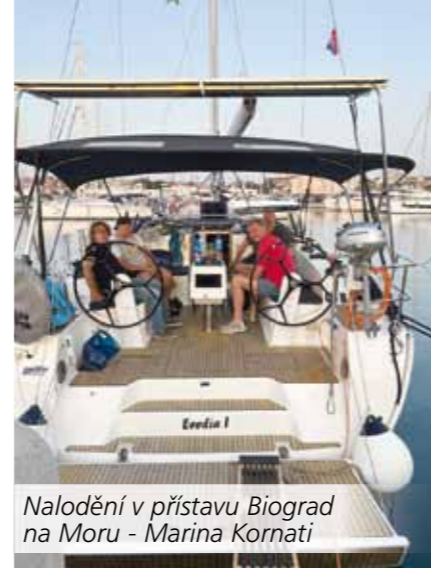
Nalodění v přístavu Biograd na Moru - Marina Kornati