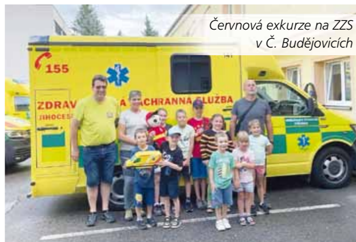
Červnová exkurze na ZZS v Č. Budějovicích

Letošní sezóna našich hasičů byla horká nejen počasím, ale i úspěchy. Během roku jsme vyjeli na deset soutěží – a to ne na výlet, ale pro medaile. A že se jich urodilo!