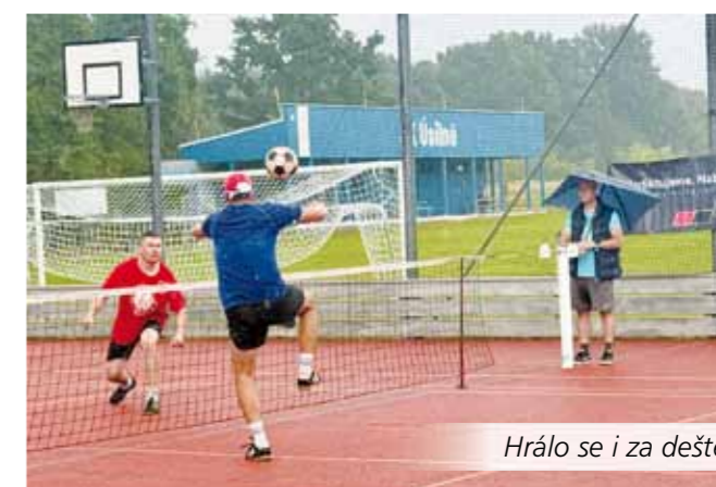
Hrálo se i za deště