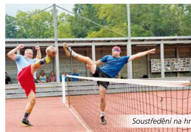
Soustředění na hru